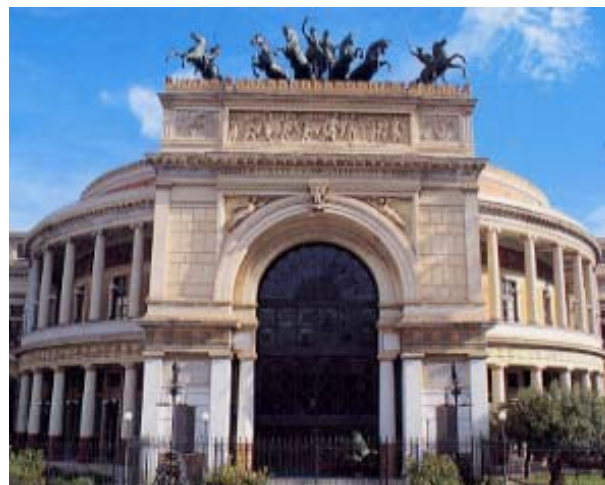
Il teatro Politeama, sede dei concerti