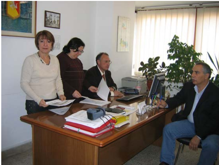
Nella foto di R.Celsa, il Responsabile (al centro) ed alcuni componenti del Servizio

Nella nostra AUSL 6, il servizio è articolato in una struttura centrale e in sedi periferiche presenti nei presidi ospedalieri, così come previsto dalle linee guida emanate dall'Assessorato Regionale alla Sanità. Il progetto di organizzazione prevede inoltre la suddivisione delle attività in tre aree: ospedaliera, territoriale e area della formazione.