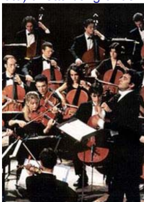
Orchestra giovanile italiana di Fiesole