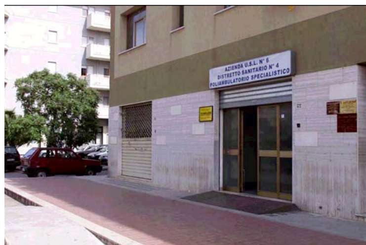
Nella foto, l'ingresso del poliambulatorio di Bagheria

Sarà una esperienza formativa! Senza alcun dubbio comincio con il lavorare sull'umanizzazione!