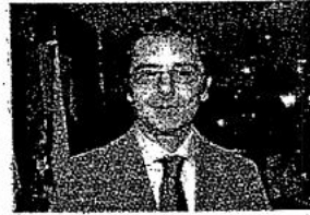
MAGISTRATO Il sostituto procuratore Ennio Petrigli titolare dell'inchiesta sulle irregolarità dei bilanci dell'Asp