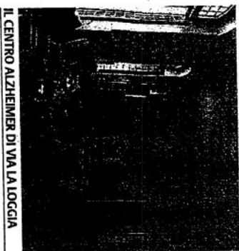
IL CENTRO ALZHEIMER DI VIA LA LOGGIA