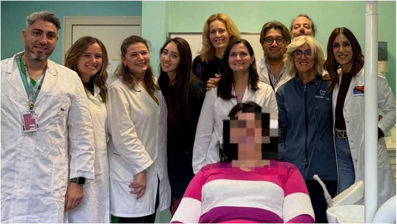
Ambulatori di prossimità odontoiatrici dell'Asp di Palermo, consegnata prima protesi gratuita